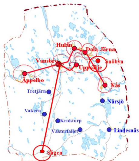
Bild 2 Kartskiss över Vansbro kommun och befintliga telestationer

Vid den uppbyggnad av bredband, som med statligt och kommunalt stöd pågick åren 2002-2005, var det framför allt ADSL-teknik som etablerades i befintliga telestationer.